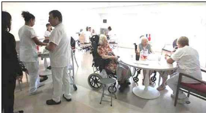
Il y a 40 000 personnes de plus de 85 ans dans les Alpes-Maritimes.

Détecteurs de chute ou de fumée, guichet unique pour les démarches, formation des travailleurs à domicile... Le conseil général, précurseur, lance dix actions novatrices